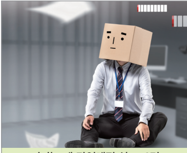
버티는 게 당연해진 삶... 3면