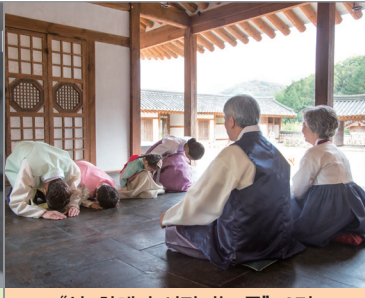
“설, 화해가 시작되는 틈” 6면