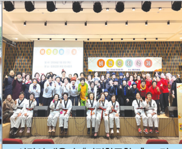
사랑의 배움터 “비전한글학교” 15면